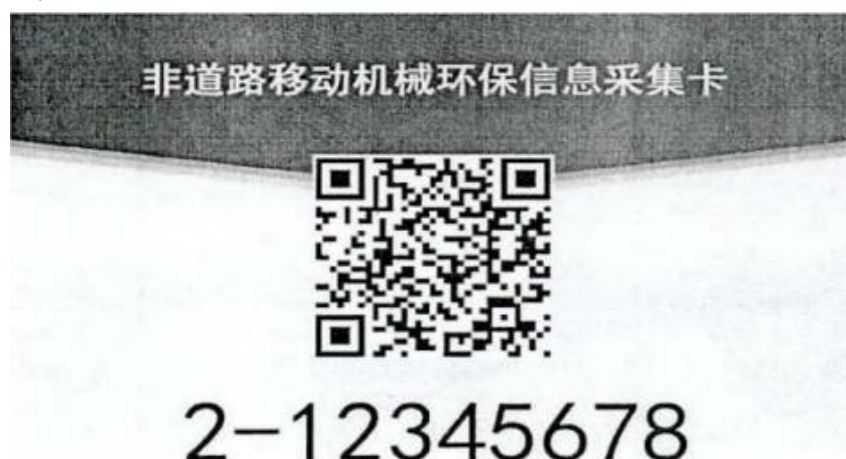
图 2：采集卡正面样式

非道路移动机械环保信息采集卡使用塑封膜加防伪层塑封，外观尺寸为长 8.8cm，宽 6cm。非道路移动机械环保信息采集卡正面样式如图 2，背面样式如图 3。