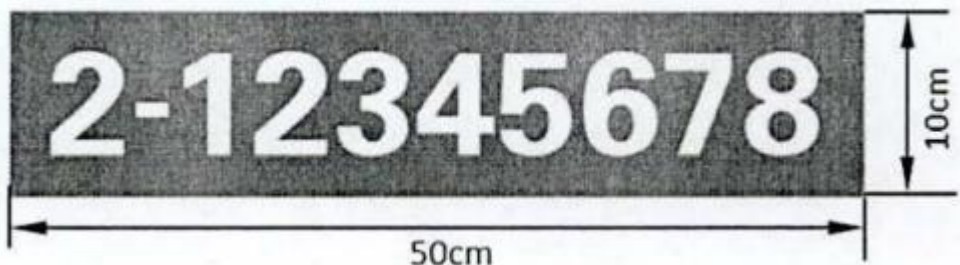
图 1：非道路移动机械环保标牌样式