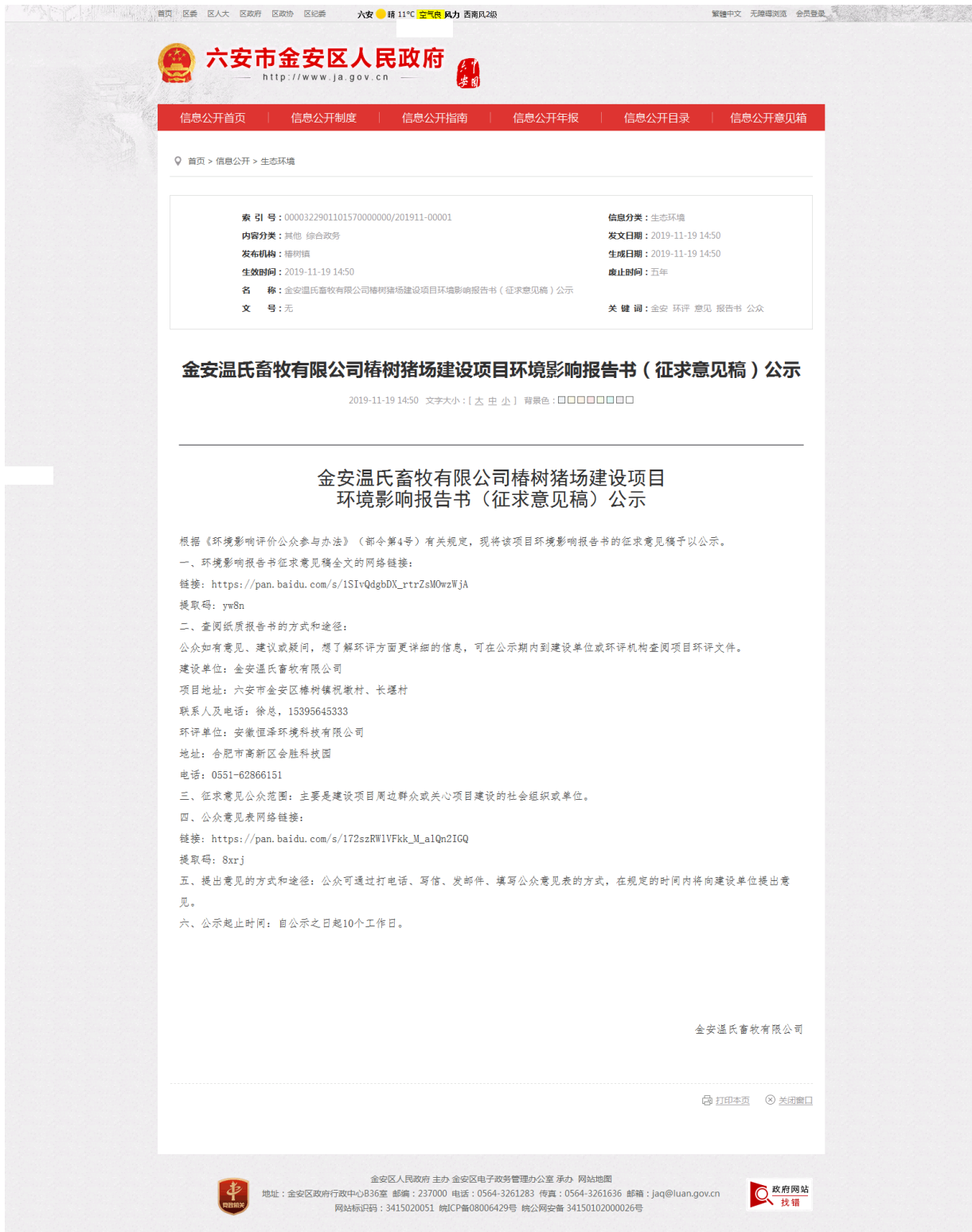
图 3-1 征求意见稿信息公开情况公示截图