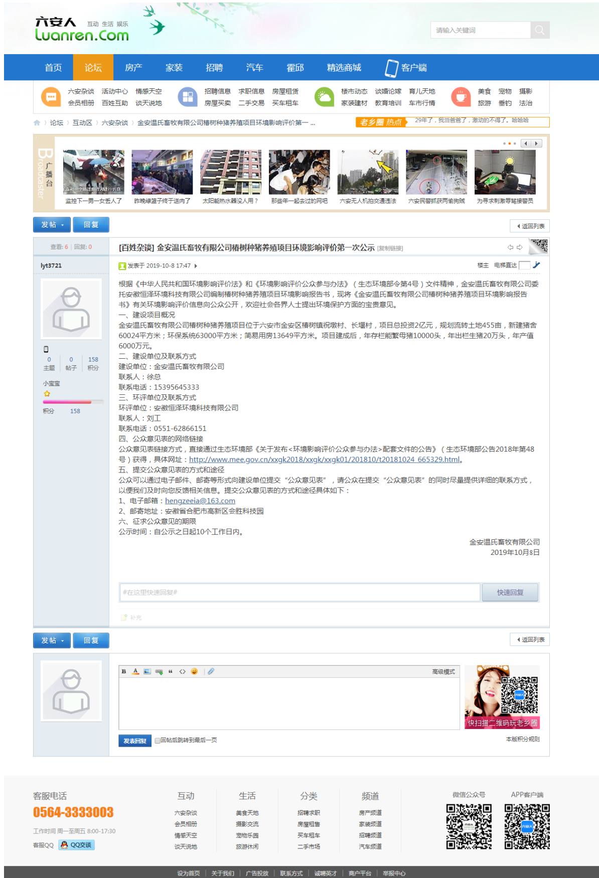
图 2-1 首次环境影响评价信息公开情况公示截图