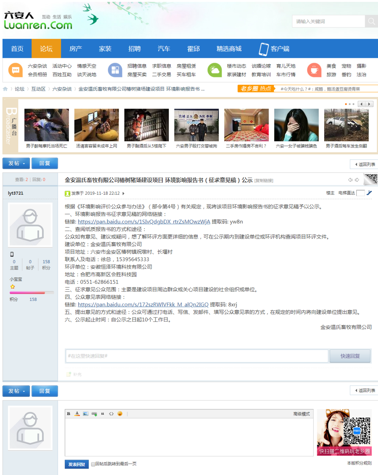
图 3-2 征求意见稿信息公开情况公示截图