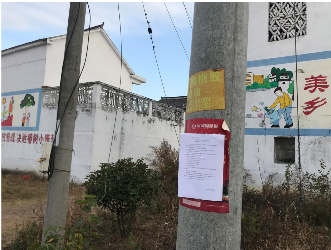
图 3-5 公示情况张贴公告照片